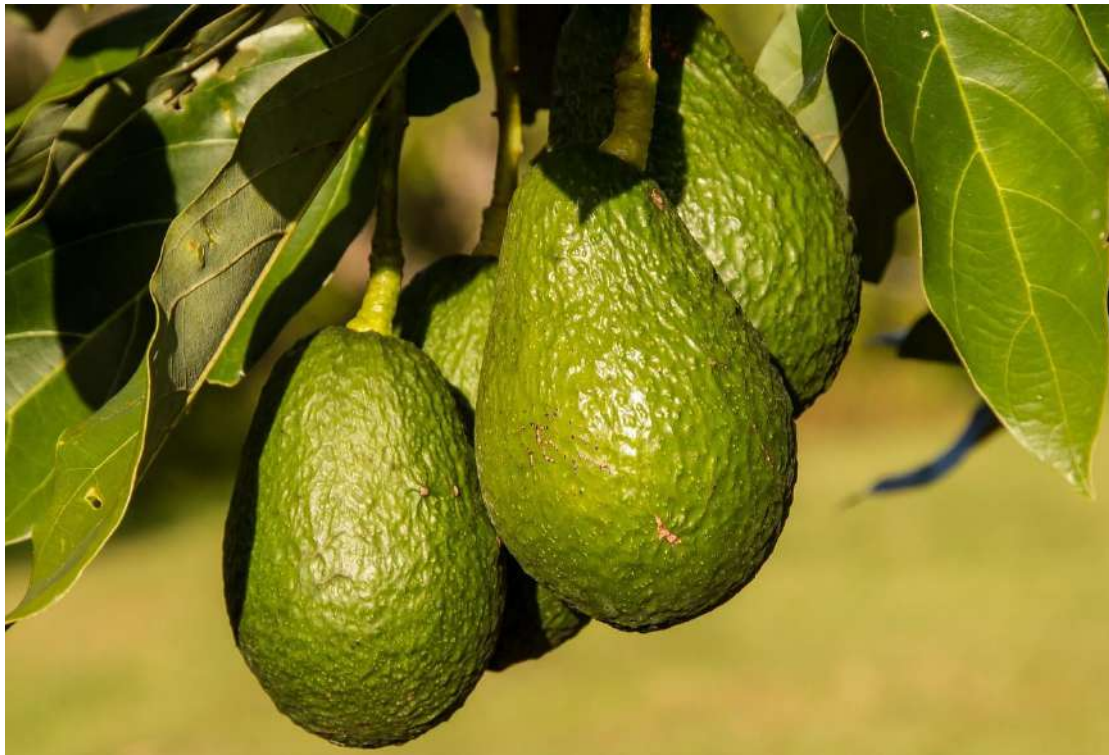
אבוקדו מזן האס.